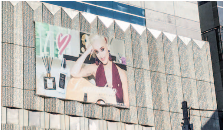
〈掲出位置〉 恵比寿駅