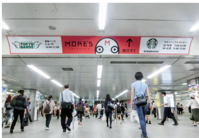
横浜ラウンドシート A