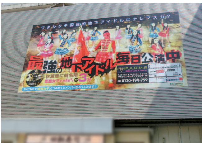
掲出位置 秋葉原駅