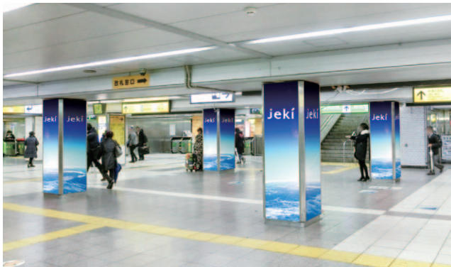
池袋駅中央改札内 (16面)