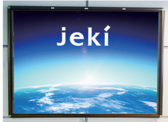
ゆりかもめ新橋駅