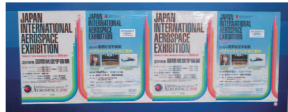
りんかい線国際展示場駅