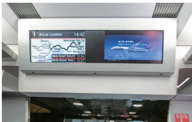
N'EXTトレインチャンネル

ニュース、天気予報、フライト情報(下り東京～成田空港間のみ)等のN'EX利用者向け必須情報とともに放映することで、より高い注目率の獲得が期待できます。