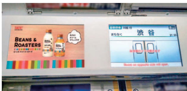
JR東日本 トレインチャンネル

東京を中心とする首都圏のトレインチャンネルと、大阪を中心とする関西圏のWESTビジョンをセットにした商品です。 新型車両数が増え、ますますネットワークが充実しました。