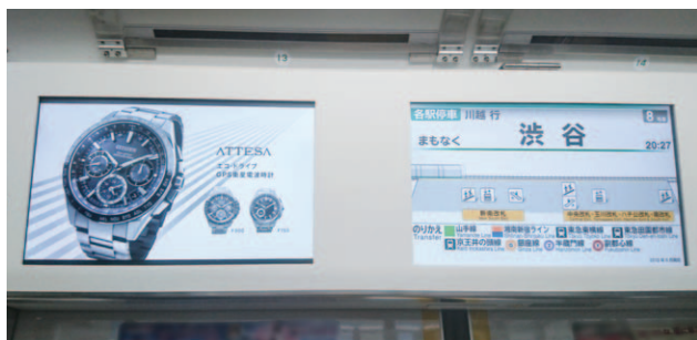
JR東日本 トレインチャンネル

東京を中心とする首都圏のトレインチャンネルと、大阪を中心とする関西圏のWESTビジョンをセットにした商品です。 新型車両数が増え、ますますネットワークが充実しました。