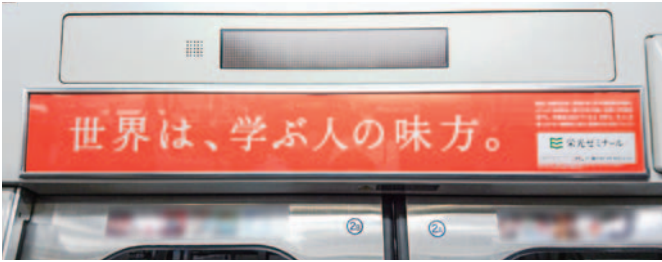
ドア上(ペーパーラジオ)