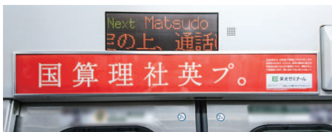
ドア上 (ペーパーラジオ)