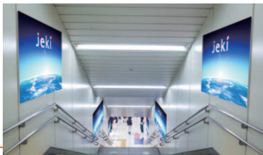
渋谷駅集中貼り(B0×55枚、B1×21枚)