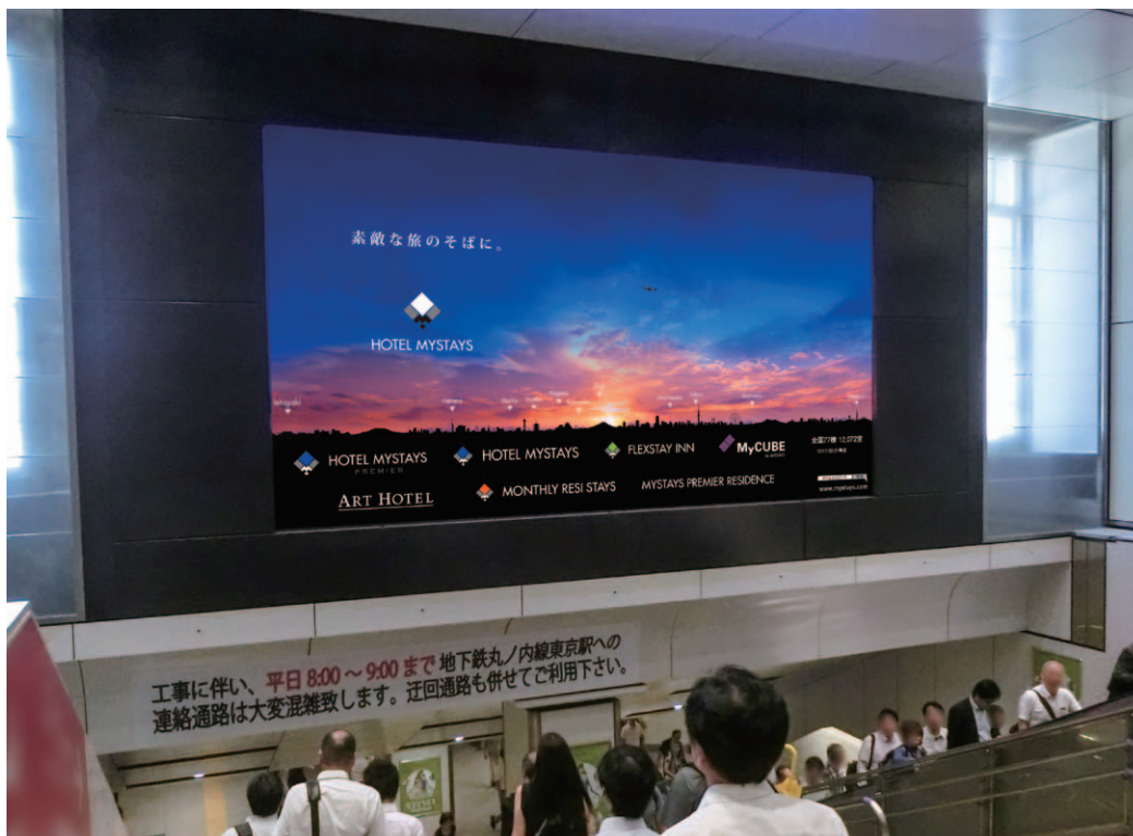
丸の内中央改札横総武階段