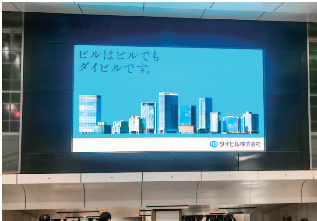
丸の内中央改札横総武階段