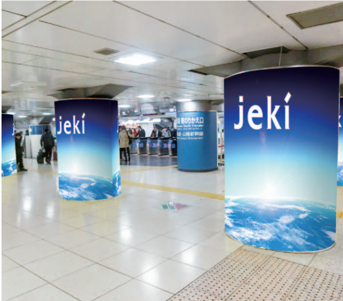
東京駅八重洲南口コンコースアドピラー