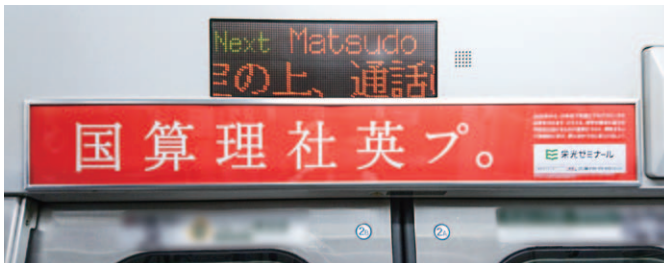
ドア上 (ペーパーラジオ)