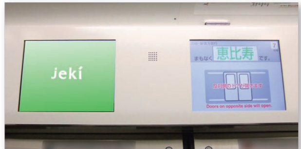
山手線・中央線快速トレインチャンネル

※1編成の全モニター数は160面、うちトレインチャンネル(広告用モニター)数は80面です。