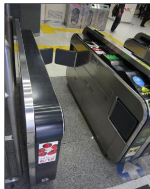
自動改札ステッカー