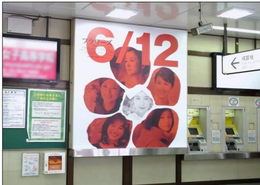
原宿スクエアボード