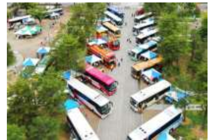
過去のバスまつりの様子

今後も、多くのお客さまにお出かけを楽しんでいただけるよう、交通事業者等との連携により対応路線の拡大に取り組んでまいります。