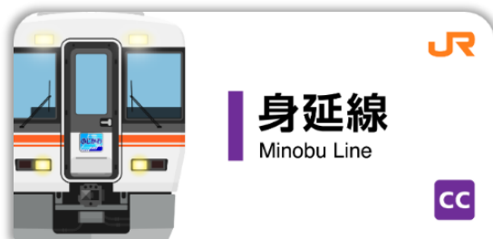
JR身延線 スタンプ帳ラベル