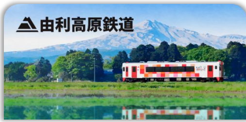
由利高原鉄道スタンプ帳ラベル