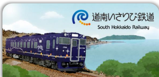
道南いさりび鉄道スタンプ帳ラベル